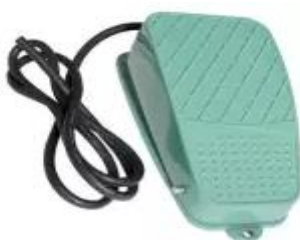
Переключатели ножные, педали