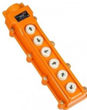
ПКТ - X1 X2 X3

Посты серии «ПКТ» - это пульты для тельферов, мостовых кранов и кран-балок. Обозначаются тремя индексами: первый — номер серии, второй — количество кнопок, третий — климатическое исполнение в соответствии с категорией размещения.