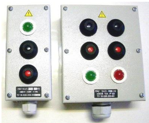
\frac{\text{ПКУ}}{1} \frac{\text{XX}}{2} \frac{\text{XX}}{3} \frac{\text{XX}}{4} \frac{\text{XX}}{5} \frac{\text{XX}}{6} \frac{\text{XX}}{7} \frac{\text{XX}}{8}

Посты серии «ПКУ» - специальные посты для эксплуатации во взрывобезопасной среде, с небольшой концентрацией газа и пыли