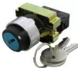
Ключ - выключатель