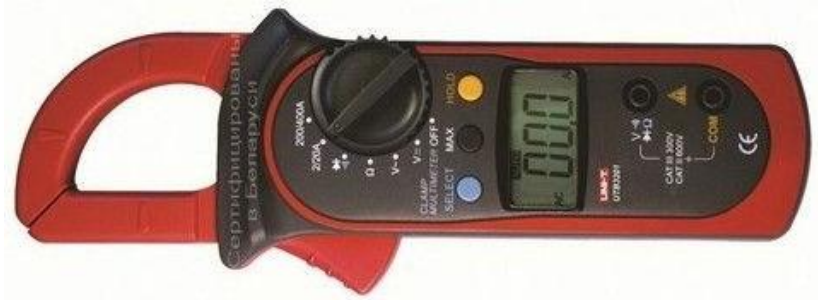
Рисунок 51 – Токоизмерительные клещи

Данный прибор универсален, позволяет измерять силу тока, а с помощью дополнительных щупов – значения постоянного и переменного напряжения, мощности, а также сопротивления цепи.