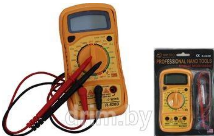
Рисунок 48 – Мультиметр

Комбинированные электроизмерительные приборы (мультиметры) позволяют измерять токи и напряжения (постоянные и переменные) и сопротивление с различными пределами измерения. Некоторые из них позволяют также измерять период и частоту переменного тока, коэффициенты усиления транзисторов, ёмкость конденсаторов, а также осуществлять прозвонку электрических цепей (рисунок 48).