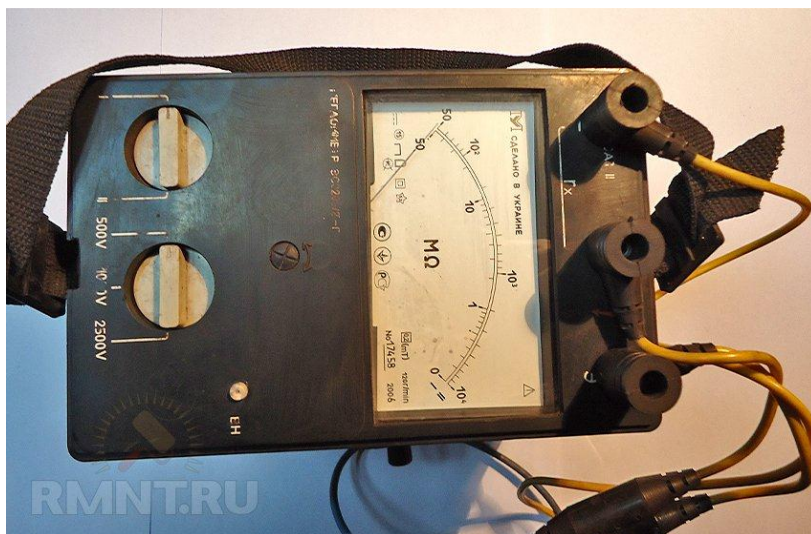
Рисунок 50 – Мегаомметр ( https://rmnt.ru )

Прибор с питанием от гальванических элементов (рисунок 50) содержит переключатель напряжения генератора и переключатель шкал измерения: диапазон I – от 0 до 50 МОм; диапазон II – от 50 до 10000 МОм.