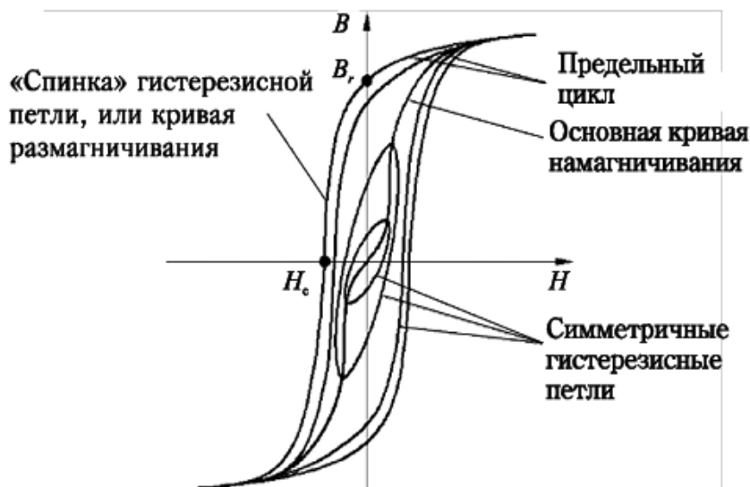
Рис. 5.11. Симметричные петли гистерезиса

ния при значениях B и H меньше тех, которые соответствуют полному насыщению, получается в виде симметричных петель магнитного гистерезиса (рис. 5.11).